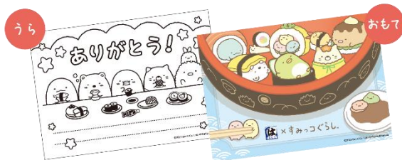
ぬりえメッセージカード

【対象商品】①父の日限定セット（5人前、4人前、3人前、1人前） ②DX おうちではま寿司セット