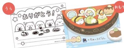
ぬりえメッセージカード