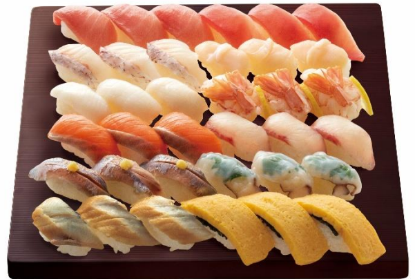
<日本の旨ネタ 6 種入り> 豪華厳選セット 3 人前 (2,640 円+税)